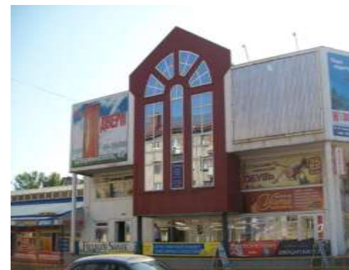
Павильон № 9, 10