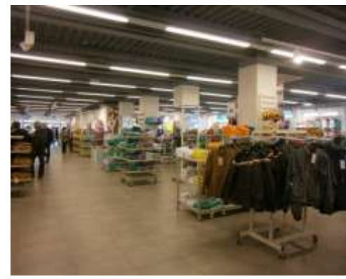
Арендные площади, Общ. пл. 6 574 кв. м.