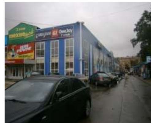
Блок А, Б, В